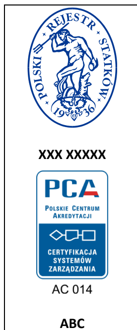
Rys. 2: Znaki certyfikacji – logo PRS S.A. i PCA